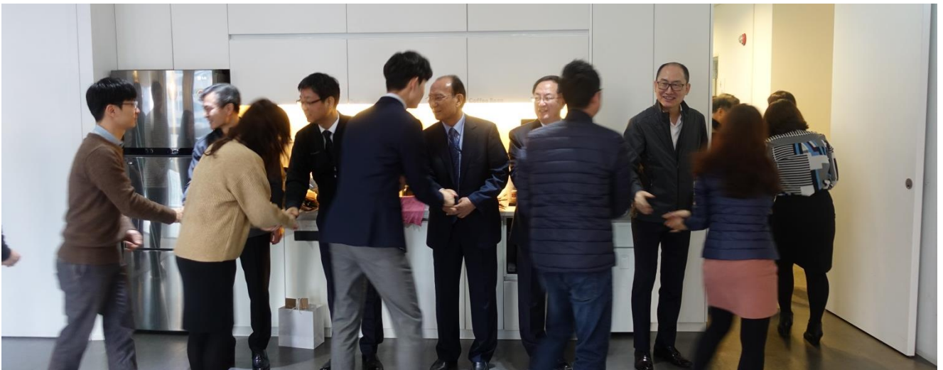
(왼쪽 위) 장기근속자 포상, (오른쪽 위) 전략경영팀 대표 다짐 한마디 (아래) 임직원 상호 간 신년인사